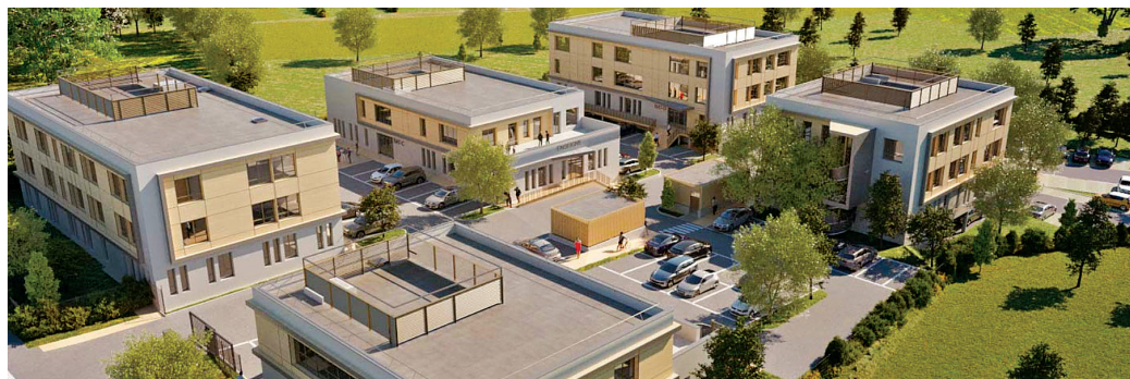
Le Village Entreprises Cap Saône Trévoux offre un cadre agréable, aisément accessible.

L'acquéreur peut faire le choix initial de la location, puis acquérir ses locaux à sa convenance après quelques années d'exercice en bénéficiant, bien entendu, de la priorité à leur acquisition.